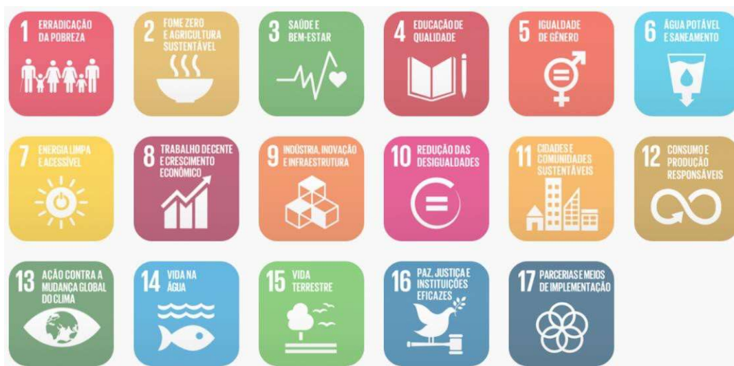
Figura 02: Objetivos de Desenvolvimento Sustentável