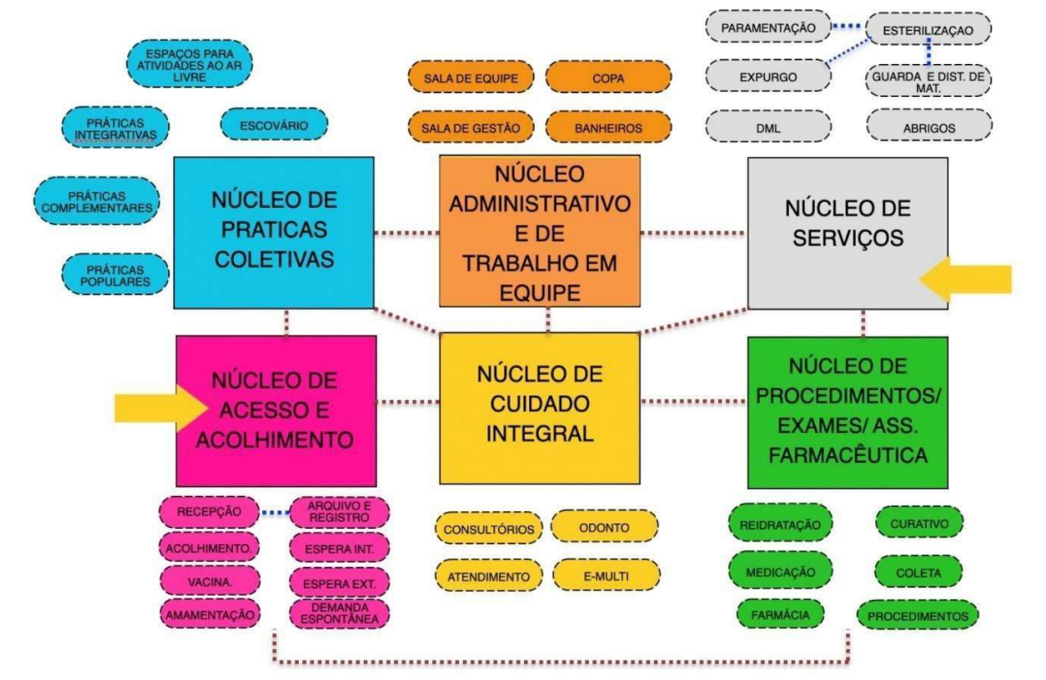
Figura 1: Diagrama de Massas